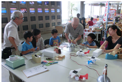
1. 先生の指導を受けながら工作