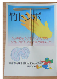
6. 竹トンボをプレゼント