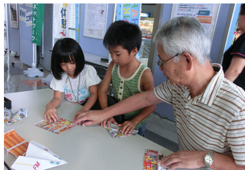
2. ちらしを使って折紙ひこうきの制作