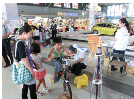
3. 自転車こいで飛行塔が回る