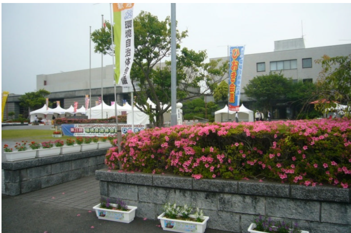
日置市伊集院文化会館