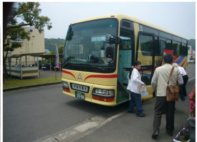
バスにて宇部⇄日置間往復:宇部市交通局