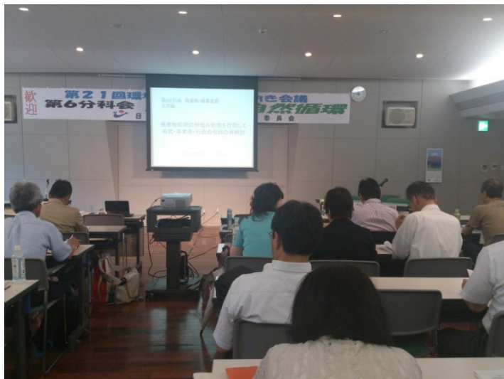
応用編: コーディネーターによる解説