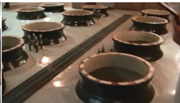
フィールドワーク: 西酒造