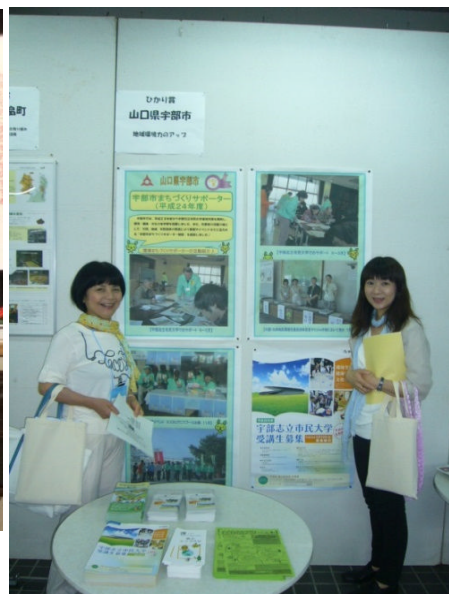
ひかり賞 受賞展示