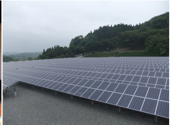
フィールドワーク: 大和電機太陽光発電～大田発電所