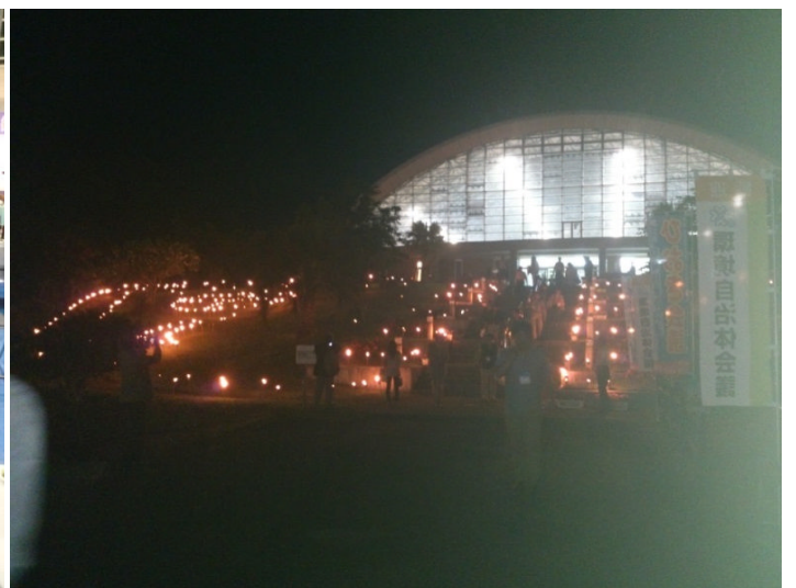
こけけドーム外景: キャンドルライトアップ