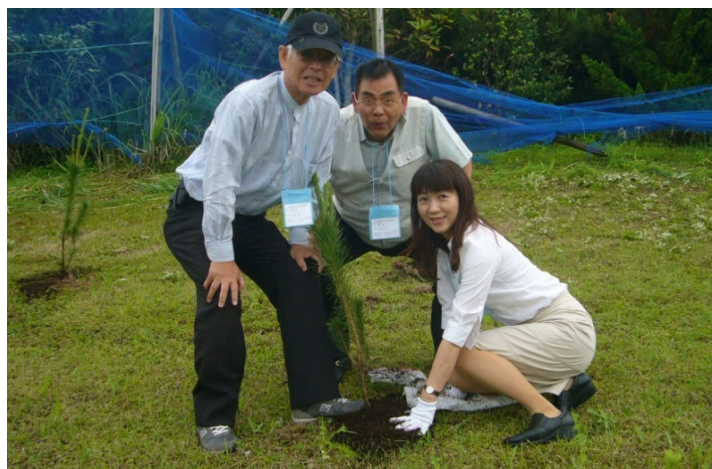
フィールドワーク: 吹上浜(松の植栽)