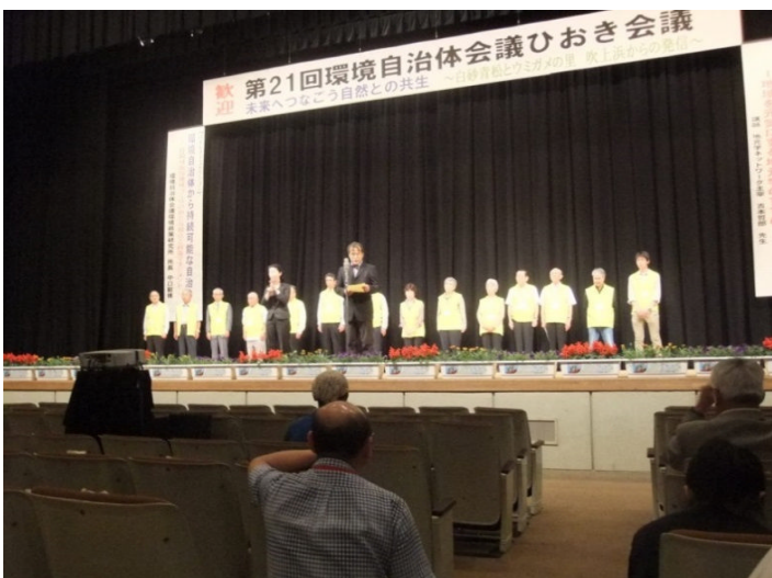
ひおき会議宣言採択