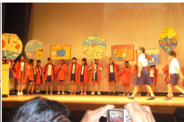
話題提供: 日置市立伊作小学校