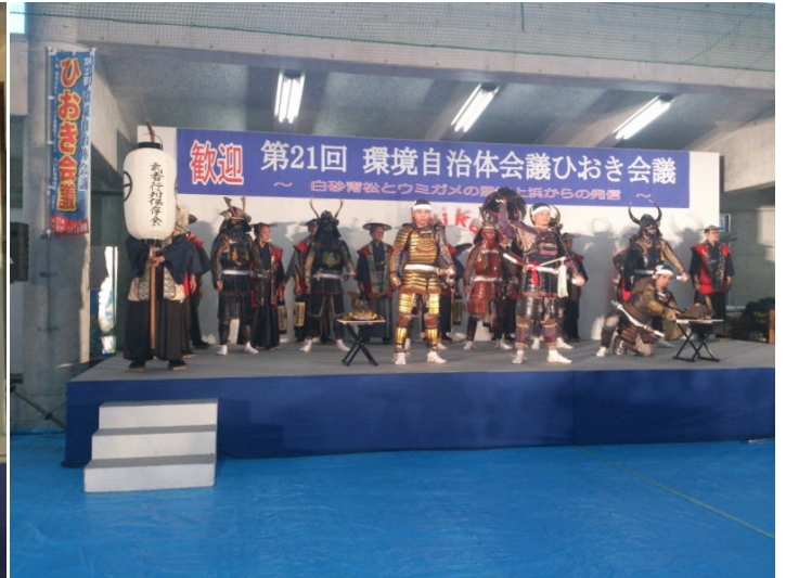
催し: 武者行列保存会