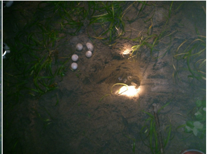
前日に産卵された卵を移動させたもの(波にさらわれるため)を見学。穴の中には70個以上の卵がある