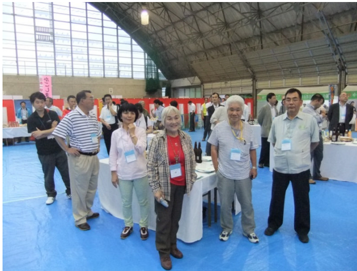
ひおき会議参加者