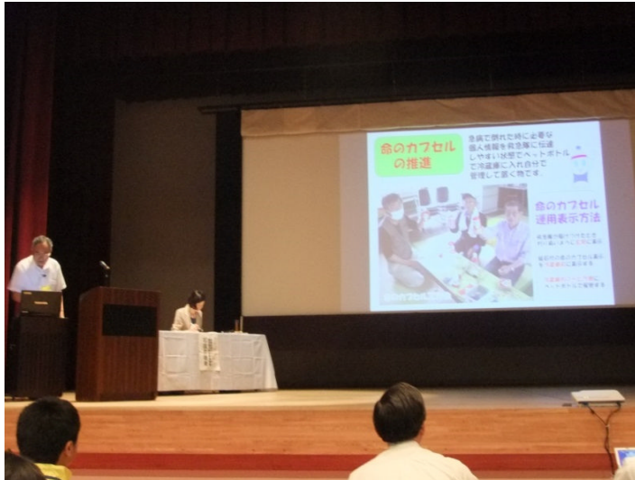
話題提供: 鹿児島県出水市