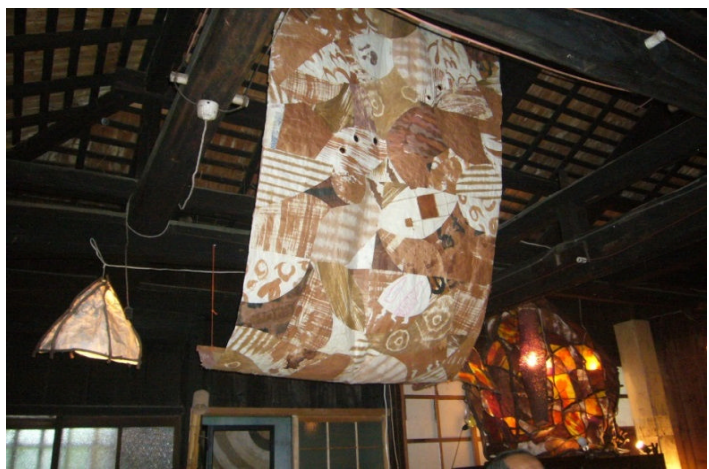
フィールドワーク: 伊作和紙体験