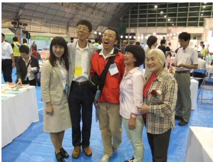
ひおき会議参加者と初日パネルディスカッションの コーディネーター(左から2番目)