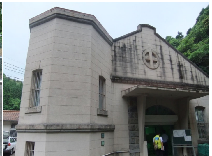
フィールドワーク: 大和電機太陽光発電～大田発電所