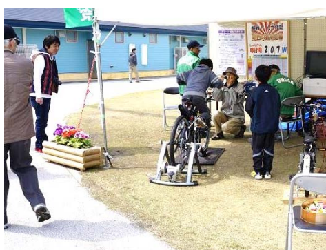
こどもには写真をプレゼント