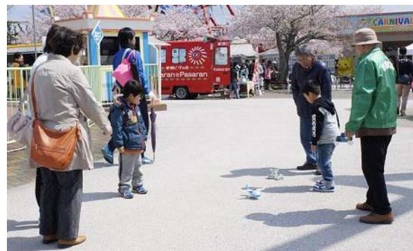
太陽がでるとソーラーカーが大人気