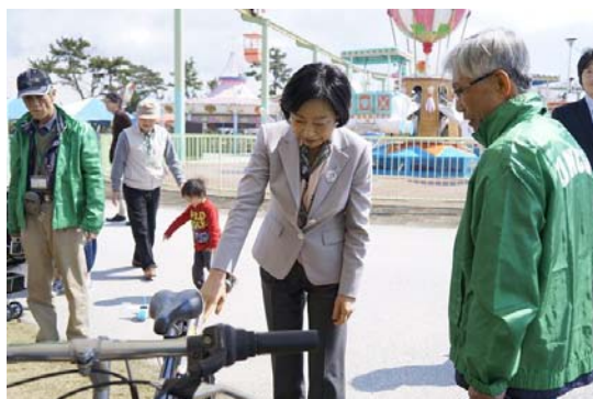
久保田市長も来館

ブースの位置が変更(本部横→トランポリン横)となり、又、天候が極端に変わり、強風と寒さのため期待ほど来場者は多くなかった。それでも、晴れたときには、多くの家族連れが、クイズや自転車発電に参加し盛り上がった。特に太陽がでると、ミニソーラーカーが子供たちに大人気となった。