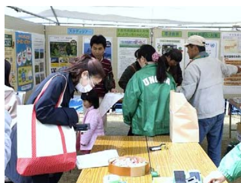
エコクイズで混雑するブース