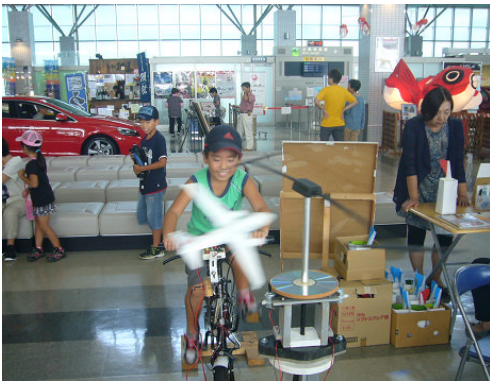
3) 自転車発電を体験