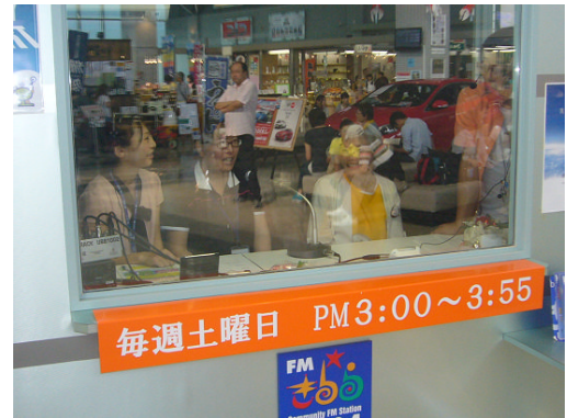
4) FM きららで UNCCA 紹介