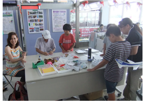
2) ちらしを使い、ひこうきを折る