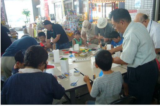
1) 先生(ボランティア)のサポートで工作