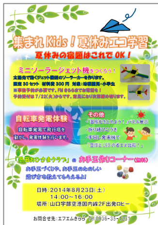
5) ちらし (FM きらら作成)