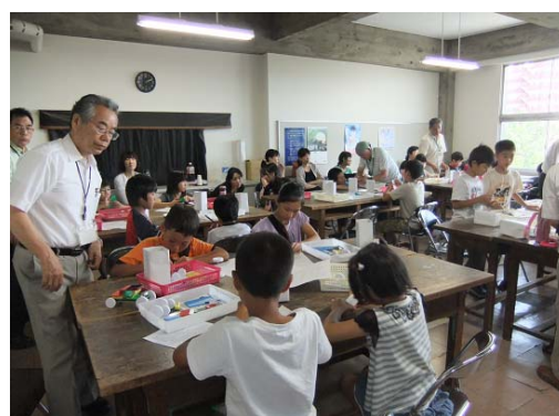
写真-6 みんな一生懸命に工作