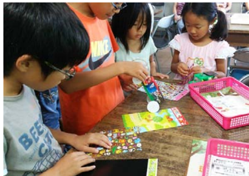
写真-8 シールを貼って最後の仕上げ