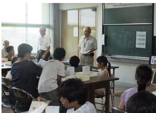
写真-5 工作の前に太陽光発電の原理を説明 (添付資料-4)