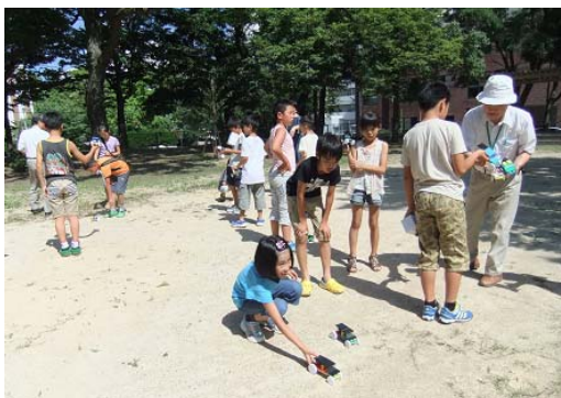
写真-7 出来たソーラーカーを太陽光で試運転

この活動は独立行政法人国立青少年教育振興機構「子どもゆめ基金」の助成を受けています。