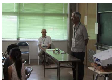
写真-1 挨拶する仰木事務局長