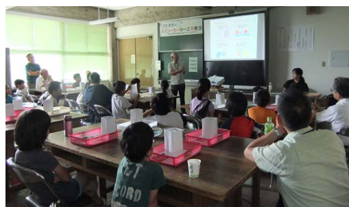
写真-2 「おひさまとエネルギーのおはなし」 をする仰木事務局長