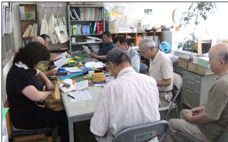
(1)キット製作前に設計図をみる指導員