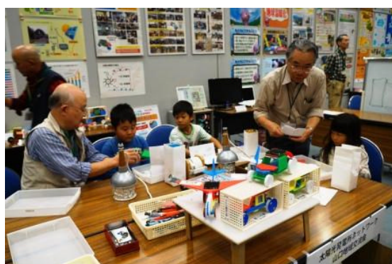
1)盛況だった工作教室