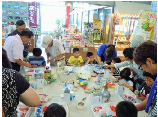
6) ミニソーラージェット機工作コーナー2