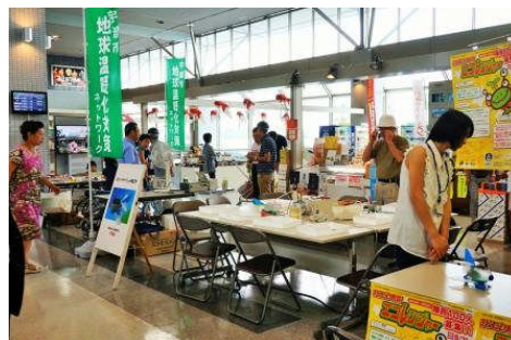
2) 開始前の会場風景