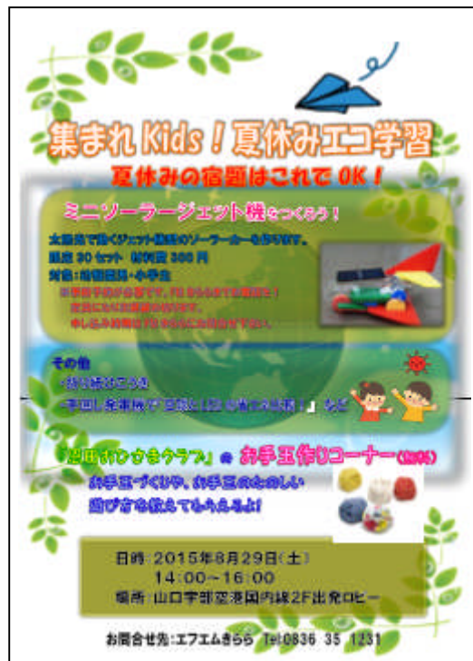
7) ポスター (FM きらら製作)