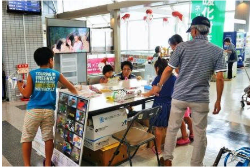
3) 折り紙飛行機コーナー