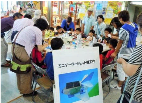
5) ミニソーラージェット機工作コーナー1