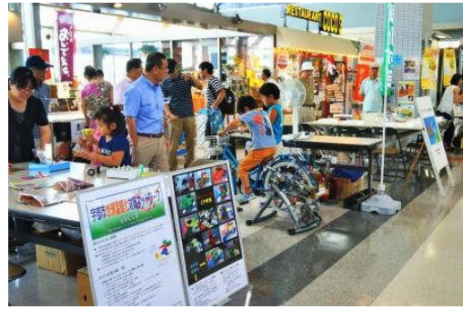
4) 自転車発電コーナー