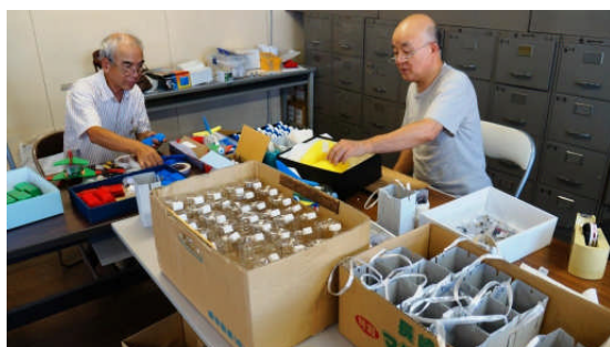
1) キット準備中(8/27, UNCCA 事務所)