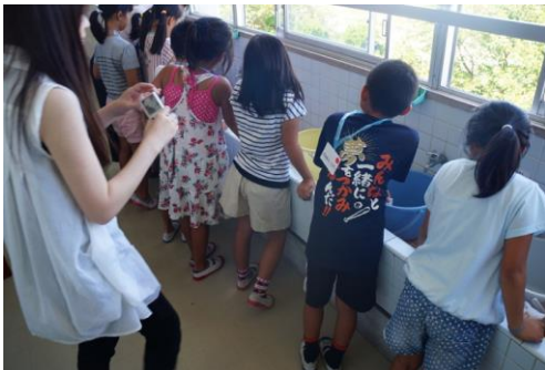
写真5：実験、順番待ち