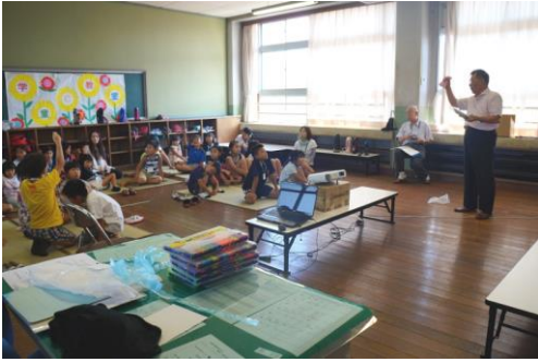
写真3：質問に答える