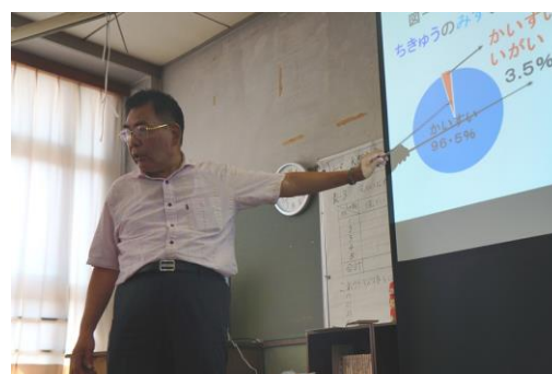
写真2：人が使える水は少ない