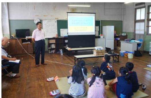
写真1：教室の始まり