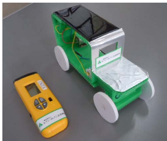
充電式ミニソーラーカーとバッテリーチェッカー