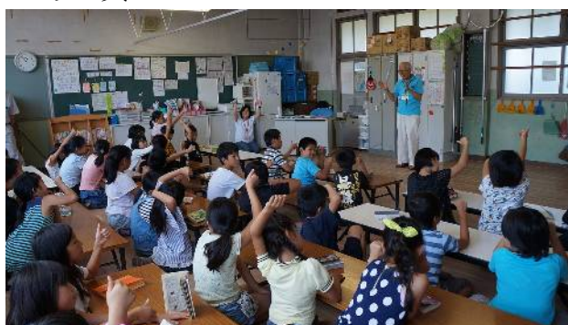
①みんな元気ですか？