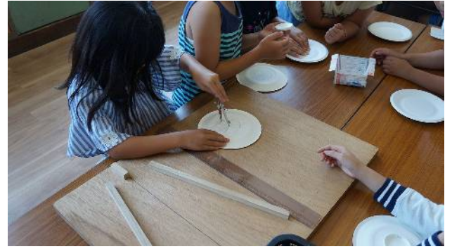
⑥中心を描いたら、コンパスを使って円を描く