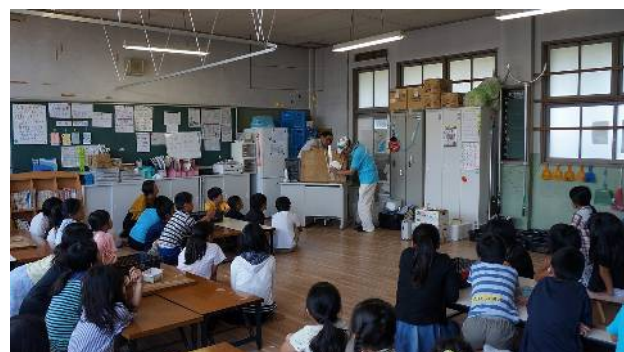
④皿の中心を見つける方法は