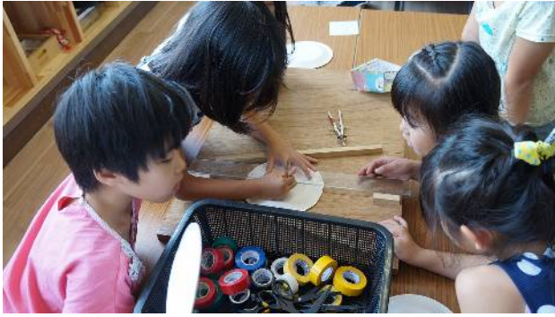
⑤道具を使い皿の中心を書く