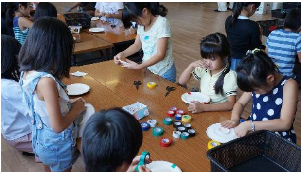
⑦4枚の紙皿をテープで貼り合わせ