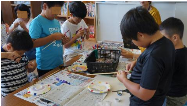
⑨はしを飾って回し棒を作る