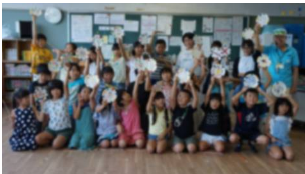
⑪記念撮影、こんな皿を作ったよ