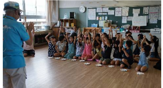
⑫今日は楽しかった！