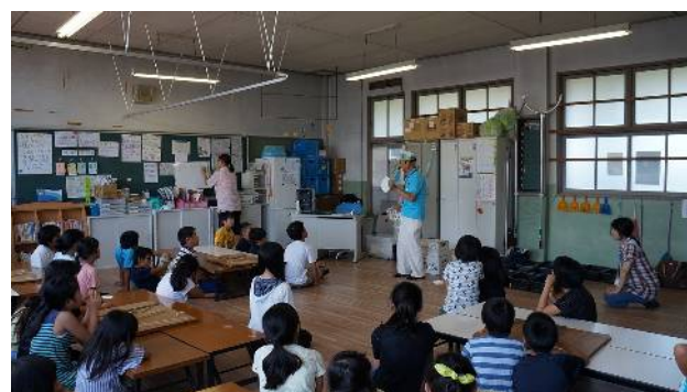
②この紙皿どうしてエコかわかる？