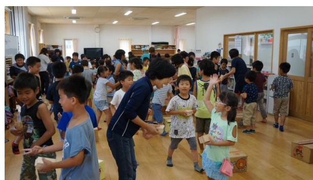
② カマボコ板を取り合うじゃんけん大会