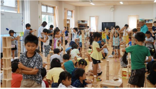
⑥ 30枚で塔を作る積み木遊び3