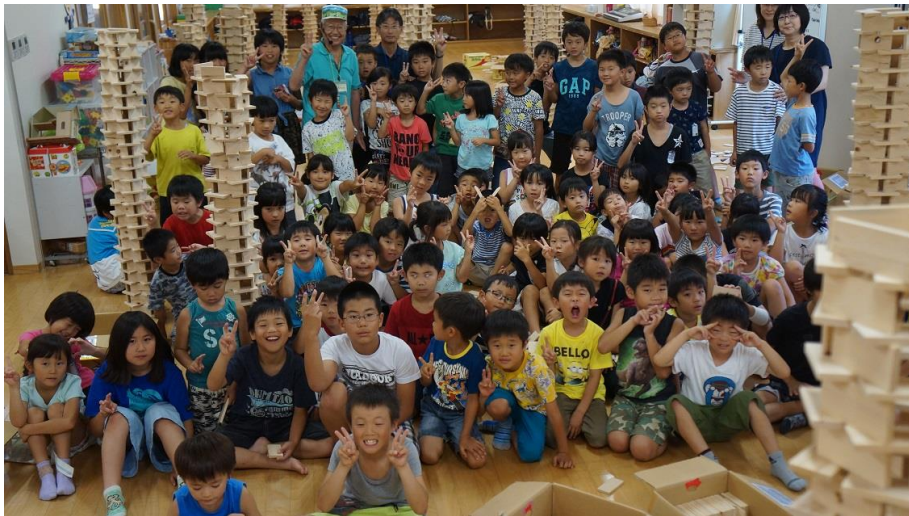
⑨ 積み木の塔の中で記念撮影