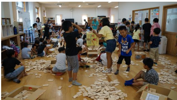
⑩ダンボール箱に後片付け