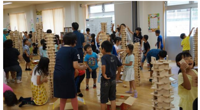
⑧チームで協力、高い塔を作る