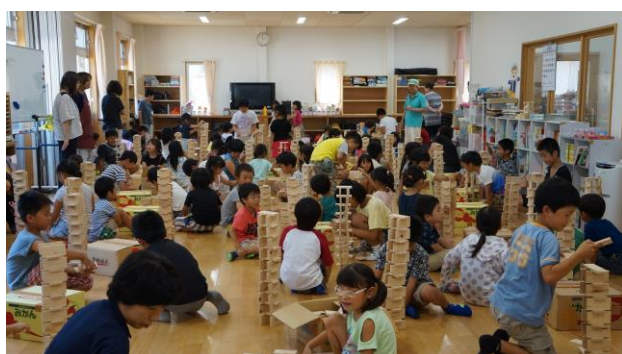
③ 30枚で塔を作る積み木遊び1