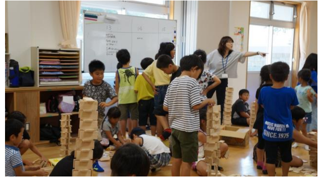
⑥積み木の段数を競う