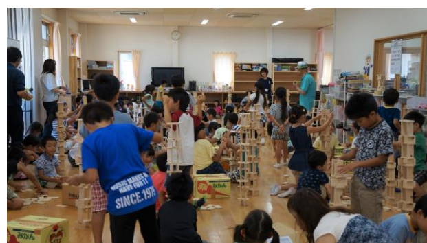
④ 30枚で塔を作る積み木遊び2