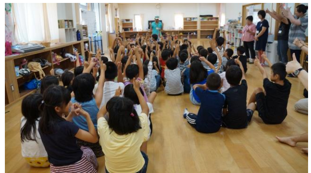
⑪今日の授業は楽しかった！