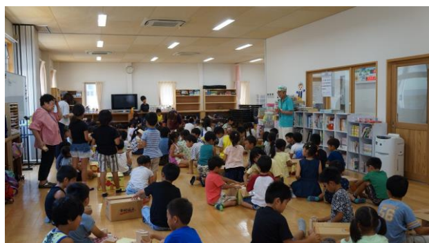
① カマボコ板になれなかったカマボコ板の話