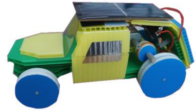
ハイブリッドミニソーラーカーモデル

日時 2016年6月30日(木) 13:00~16:00 (7月1日(金) 13:00~15:00) 場所 宇部市地球温暖化対策ネットワーク (UNCCA) 事務所