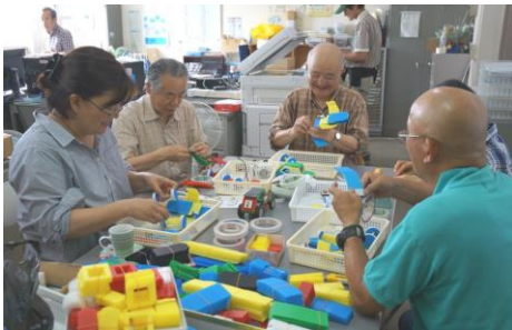
①和気あいあい組立て学習会