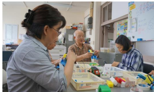
②真剣に組立てを学習する指導員