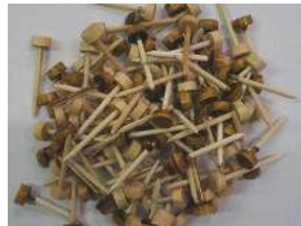
④前輪方向板留めピン