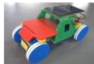
ハイブリッドミニソーラーカーモデル