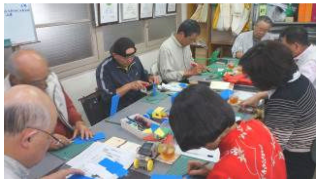
⑤熱心にプラダンを加工するボランティアの方々