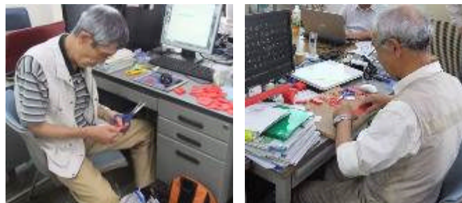
⑥UNCCA スタッフもプラダン加工