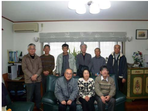
懇談のあと参加者記念写真