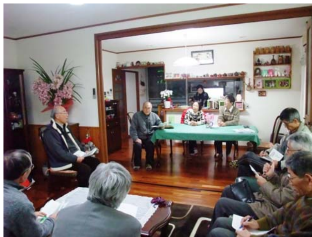
太陽光発電とグリーン電力について懇談