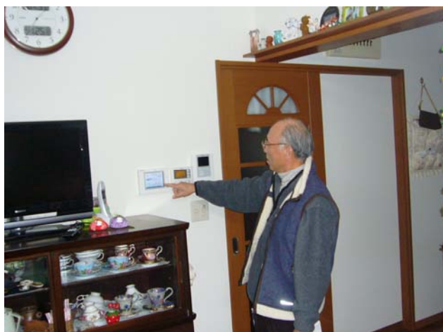
松重所長がモニターにて発電量の説明