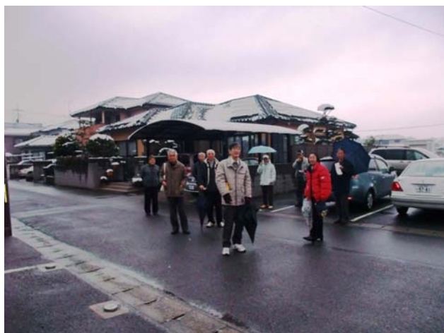
松重太陽光発電所前で参加者記念撮影