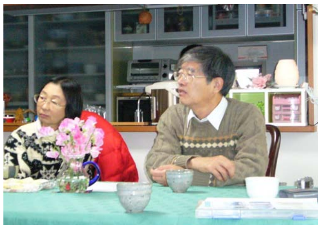
熱心に討議される会員

残念ながら雪でモジュールが良く見えませんが、寒い中を皆さん熱心に見学されました。