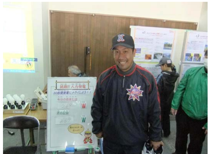
発電量最高記録達成者（269 Kw）