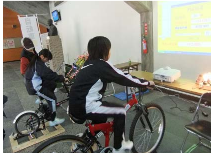
自転車発電体験（26インチ）