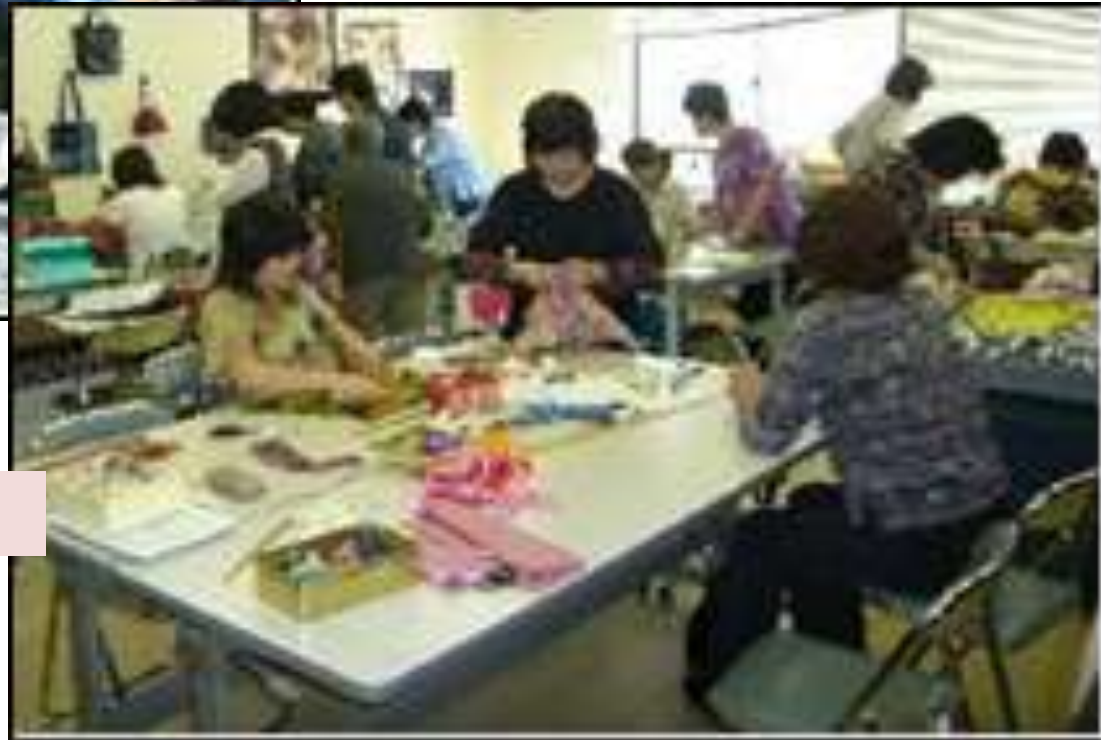
オリジナルマイバッグの作成