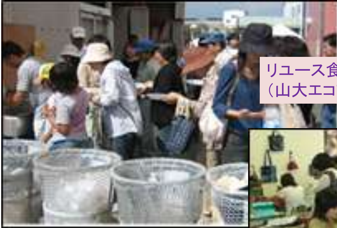
リユース食器の使用推進 (山大エコファイターズと協力)