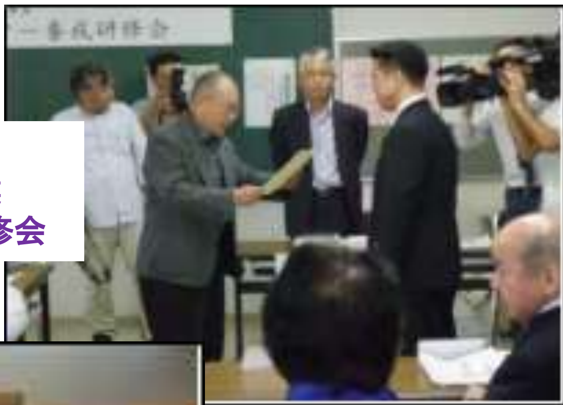
(2008年10月) 省エネ家電普及促進事業 省エネマイスター養成研修会