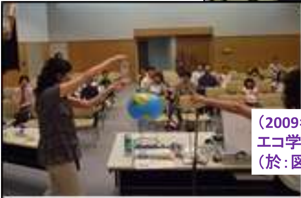
(2009年8月) エコ学習トランク環境講座 (於:図書館)