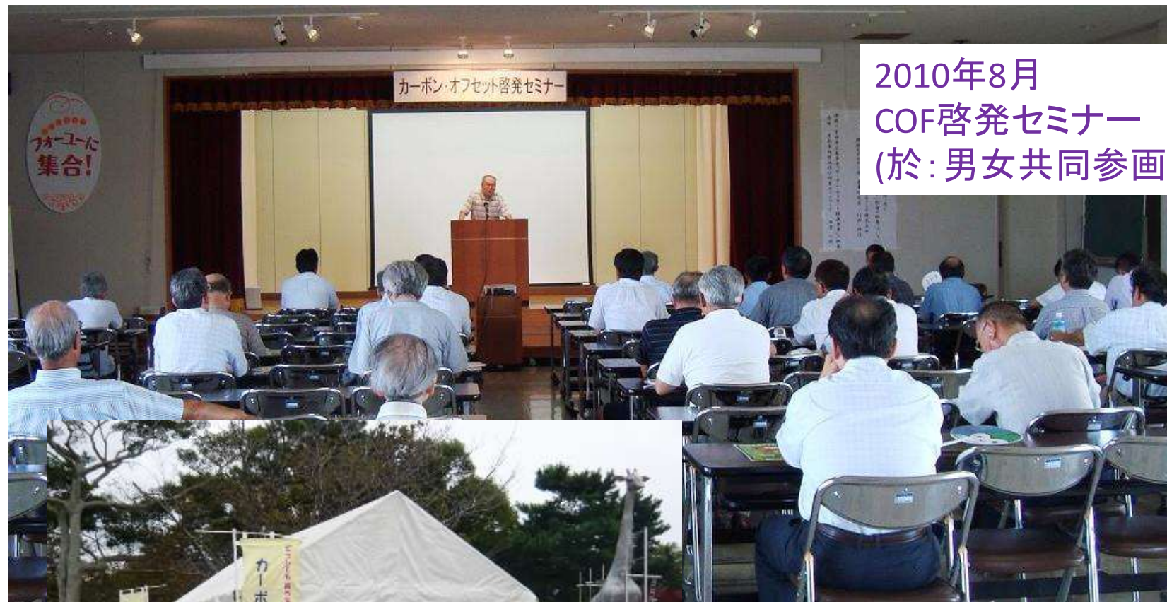
2010年8月 COF啓発セミナー (於:男女共同参画センター)