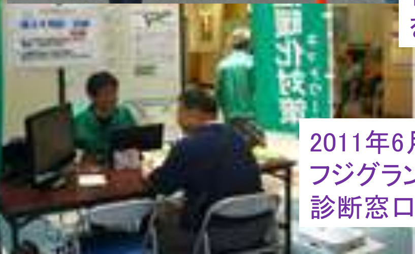
2011年6月 フジグラン宇部にて省エネ相談・ 診断窓口開設(3日間)