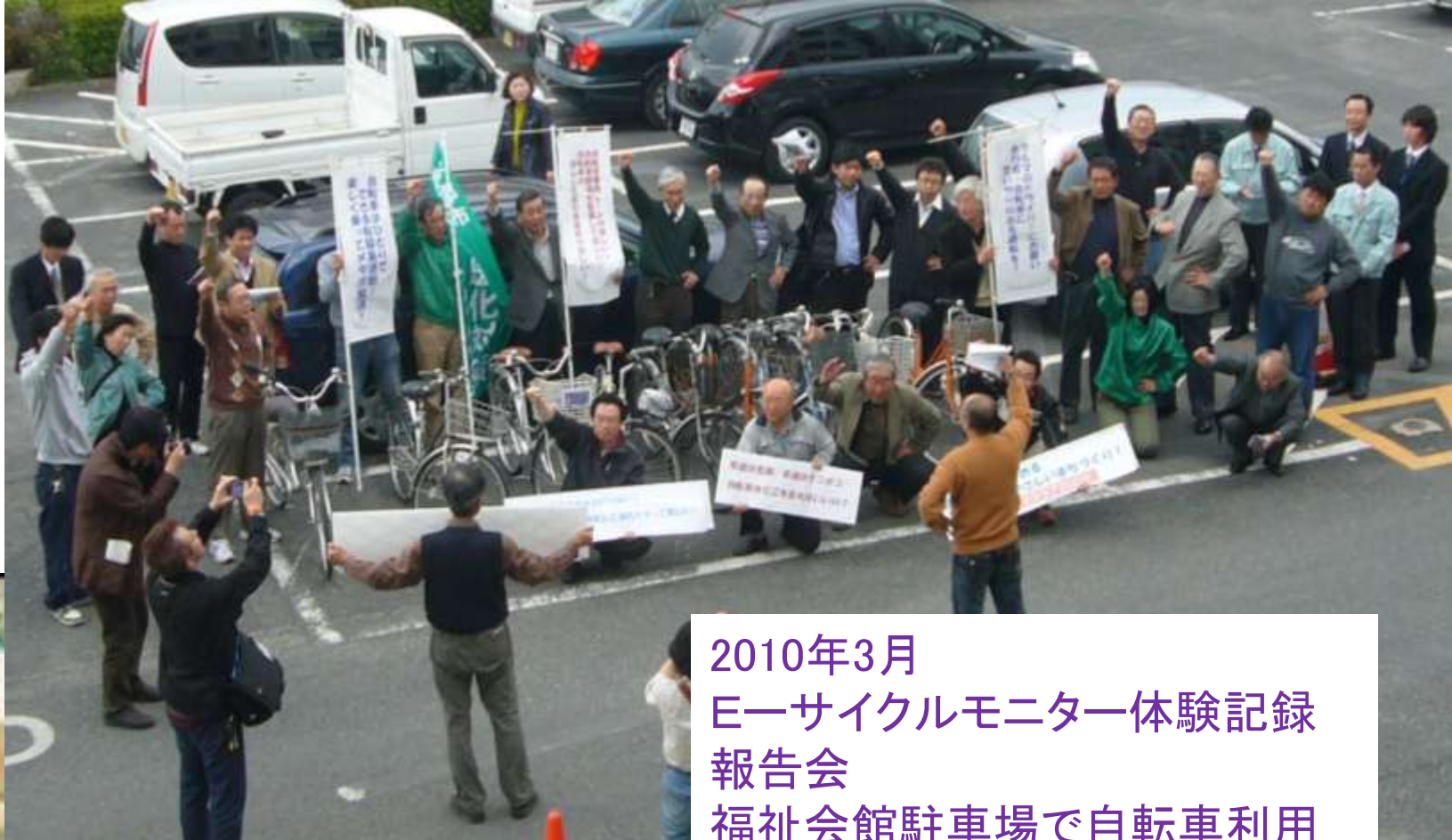
2010年3月 Eーサイクルモニター体験記録 報告会 福祉会館駐車場で自転車利用 をアピール