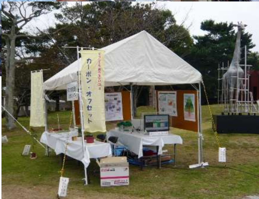
2010年10月 エコフェア in UBEでの展示ブース (於:ときわ公園)