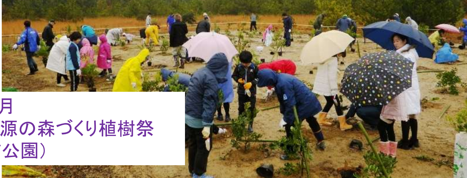
2012年3月 CO2吸収源の森づくり植樹祭 (於:亀浦公園)