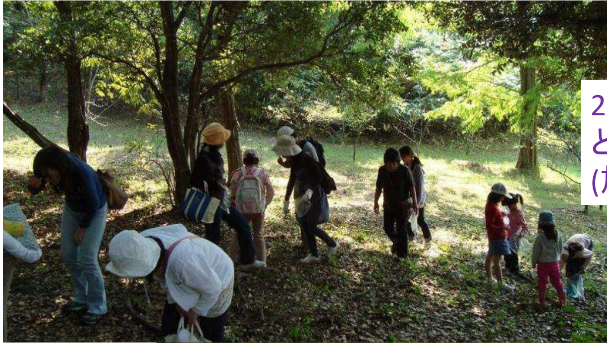
2010年10月 どんぐり拾いイベント (於:二俣瀬)