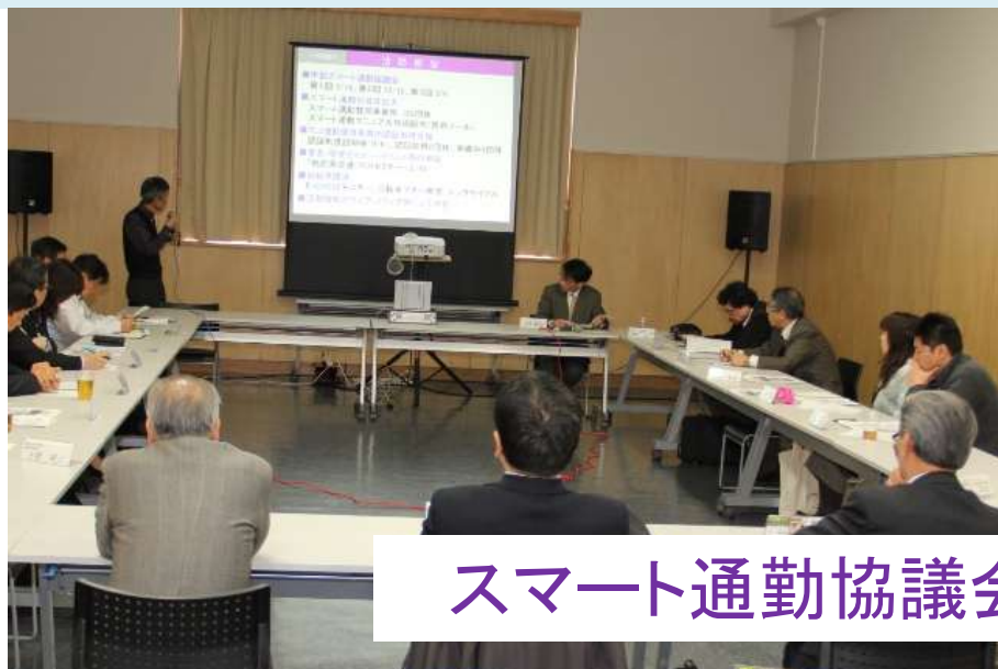
スマート通勤協議会